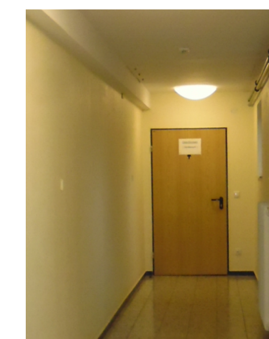
9 Austausch Innentürblätter