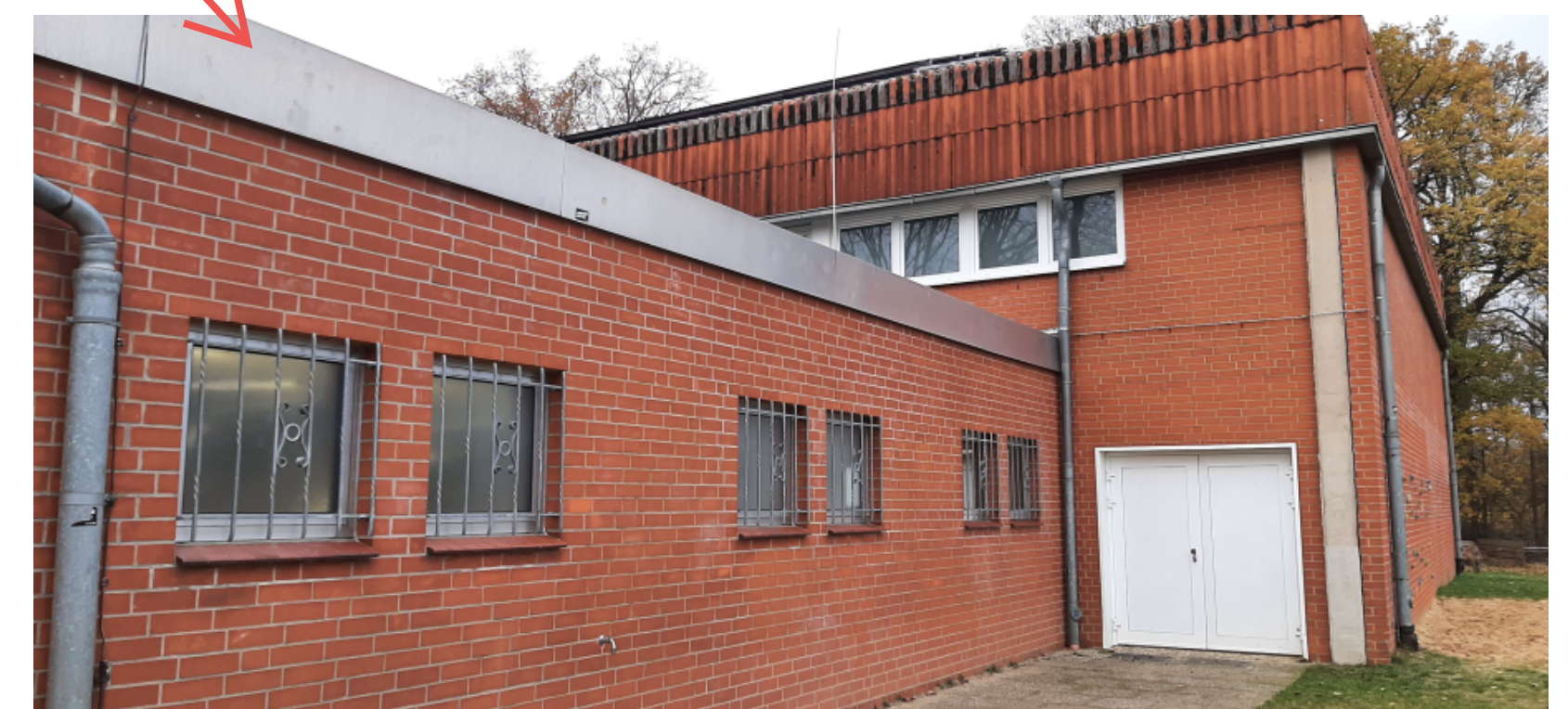
7 Austausch Fenster von 1975