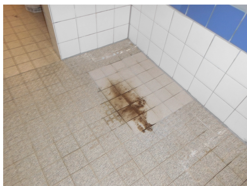
11 Erneuerung Wand- und Bodenfliesen in Umkleiden