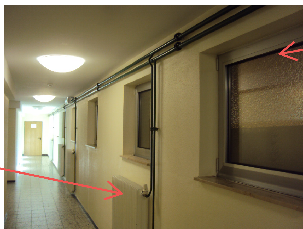
8 Fenster verschließen Richtung Vereinsheim