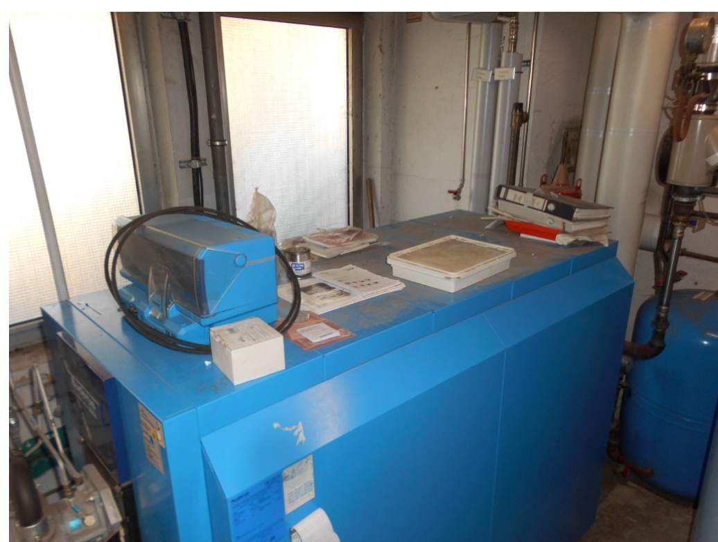
20 Erneuerung Heizungsanlage