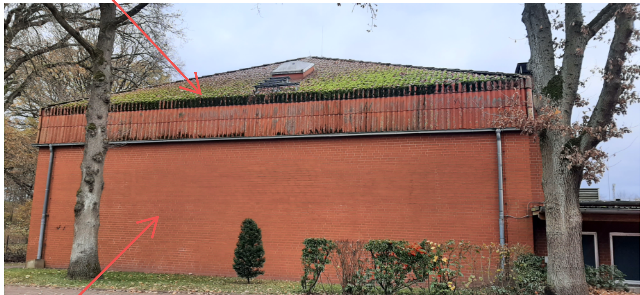
15 Energetische Sanierung Außenwände