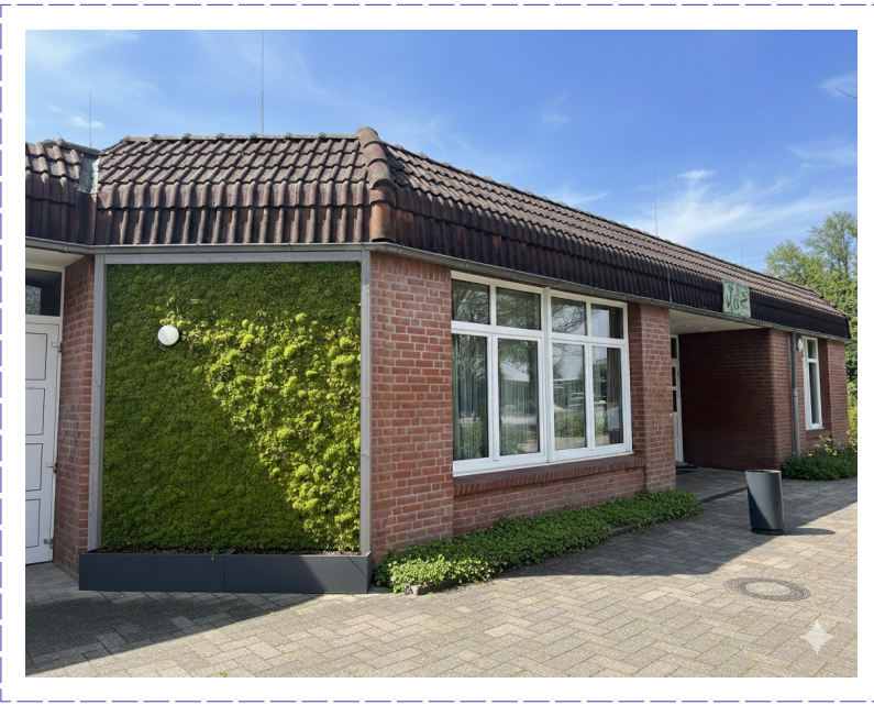
Ansicht Eingangssituation JUZ mit Fassadenbegrünung "MoosMoos"