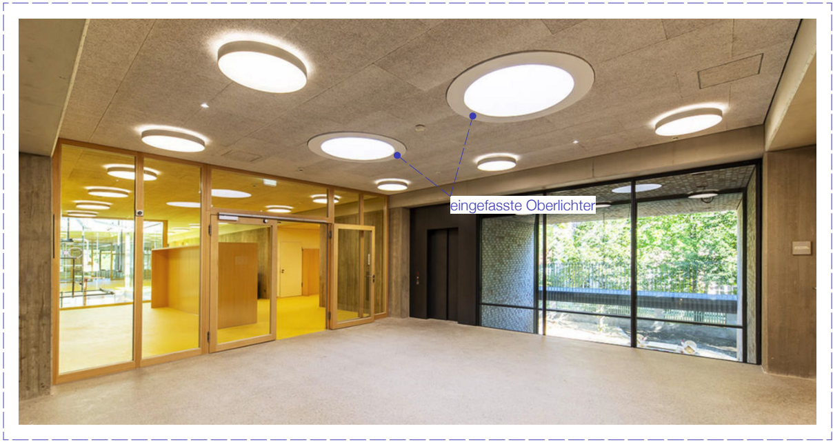
Beispiel Innenansicht Schule Pfanztelplatz vollflächige Akustikdecke mit Aufputz LED Beleuchtung und eingefassten Oberlichtern