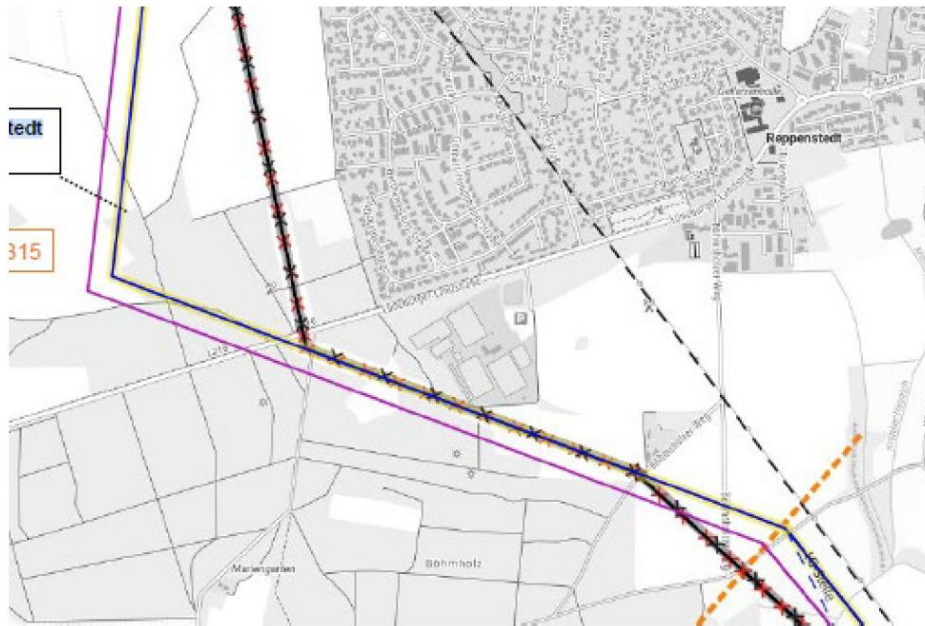
Abbildung 1: Auszug aus der Landesplanerischen Feststellung vom 01.10.2024

(gelb hinterlegte dunkelblaue Linie: ONiL-Vorzugstrasse mit 110-kV-Mitnahme; violette Linie: verlegte 380-kV-Bestandsleitung; gestrichelte blaue Linie: Neubau 110-kV-Leitung; grau hinterlegte schwarze Linie mit schwarzen und rote Kreuzen: Rückbau 380-kV-Bestandsleitung mit 110-kV-Mitnahme; gestrichelte schwarze Linie: 110-kV-Bestandsleitung; gestrichelte orange Linie: Trennungslinie Trassensegmente; Quelle: eigene Darstellung; ohne Maßstab)